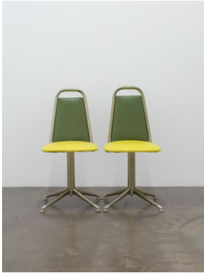
木村友紀「11」2009, two identical child chairs, 32 x 34 x 68 cm each, unique