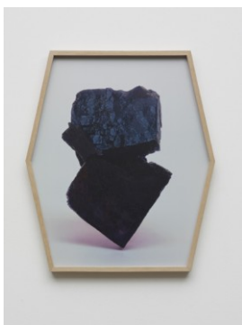
前田征紀「Elemental / Receptor」2011, ラムダプリント, フレーム, 62 x 53.5 x 5 cm