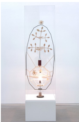
ピョーン・ダーレム「宇宙」2008, wood, steel, light bulb, red wine, bottle, pebble, 170 x 45 x 45 cm (Courtesy of the artist and hiromiyoshiroppongi)