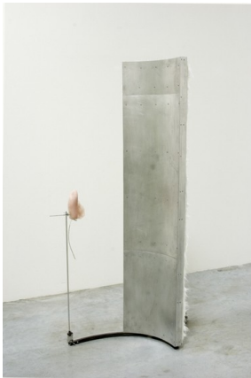
土屋信子「Introduction Shuttle」2007, mixed media, main: 181 x 52 x 76 cm / small parts: 100 x 26 x 9 cm