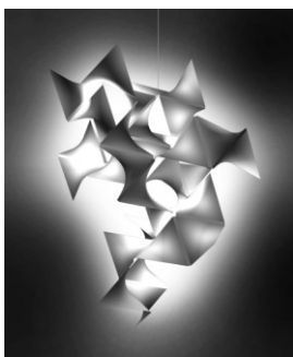
平田晃久「Flame frame」2008, aluminum, dimensions variable

(Courtesy of akihisa hirata architecture office)