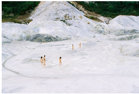
山谷佑介 「ONSEN #042」、2022 年 C プリント 64 x 96 cm © Yusuke Yamatani