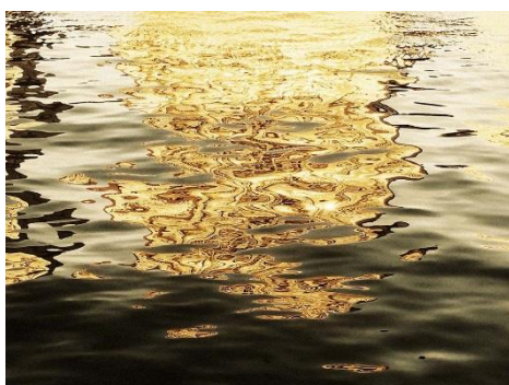
武田陽介 「161234」、2013年 ライトジェットプリント © Yosuke Takeda