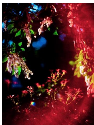
武田陽介 「071949」、2019年 ライトジェットプリント