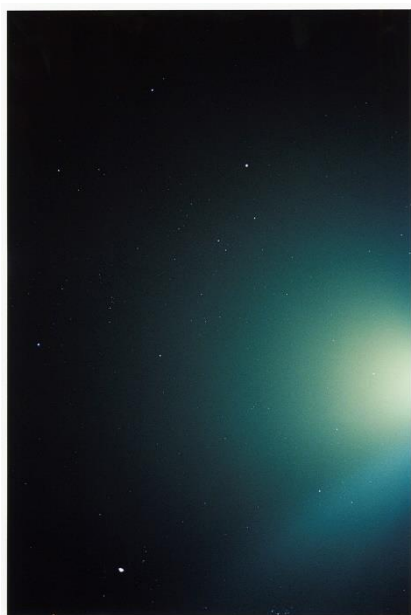
塩田正幸 「時間」2012年 / 2020年 C-print © Masayuki Shioda