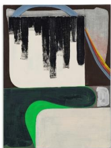
Erwin Bohatsch “Untitled”, 2023 Acrylic, oil on canvas 135 x 100 cm