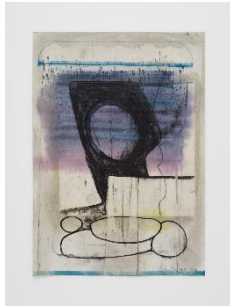
Erwin Bohatsch “Untitled”, 2020 Mixed media on paper 29.7 x 21 cm