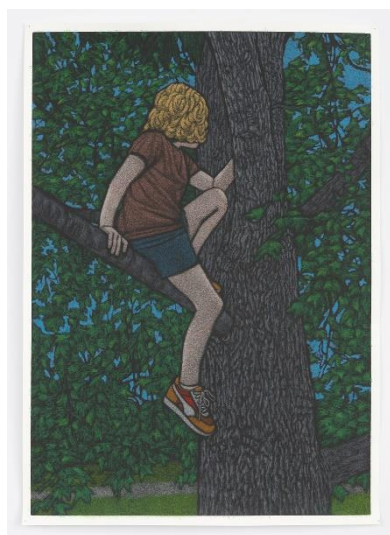
Amy Adler, "A Safe Place", 2022

Pastel on paper, 69.8 x 49.5 cm © Amy Adler