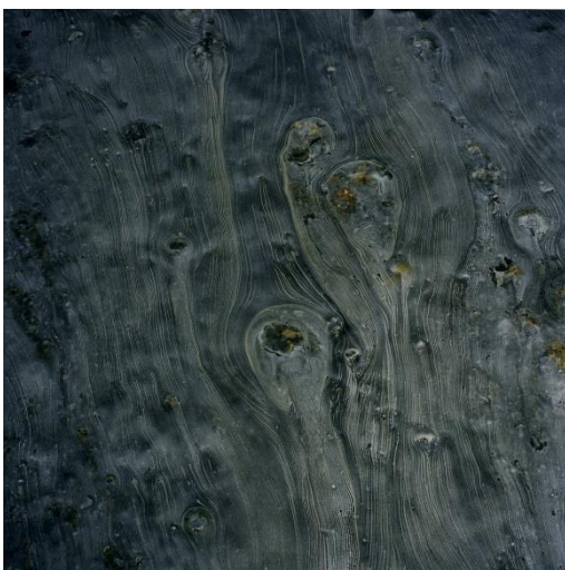
Naoya Hatakeyama "Underground / Water #6607", 1999 C-print 110 x 110 cm © Naoya Hatakeyama