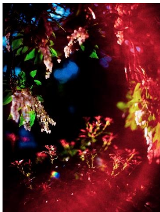
Yosuke Takeda “071949” , 2019