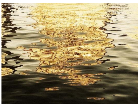
Yosuke Takeda “161234” , 2013