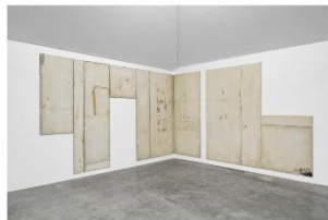
Right: Rafik Greiss, "Bitter to be present", 2025, plaster plates, patinated, 215 x 482 x 1.8 cm (Install at SIMIAN, Copenhagen, Denmark, curated by Fabian Flückiger) © Rafik Greiss.