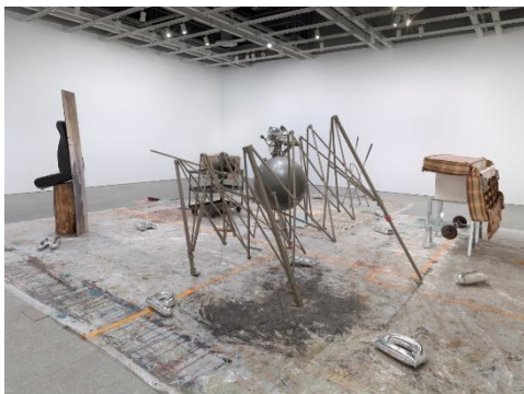
Ser Serpas, "taken through back entrances subtle fate matching matte thing soiled...", 2024, found objects, plastic tape, oil paint. Installation view at Whitney Museum of American Art, New York. From the 2024 Whitney Biennial.