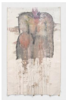
Left: Ser Serpas, "Untitled", 2026, oil on canvas, 302.3 x 182.9 cm

e-mail: tig@takaishiigallery.com website: www.takaishiigallery.com