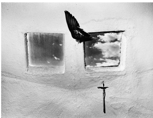
Ikko Narahara, "Sky Through Twin Windows, Colorado" from "Where Time Has Vanished", 1972/1975, gelatin silver print, 22.3 x 29.9 cm