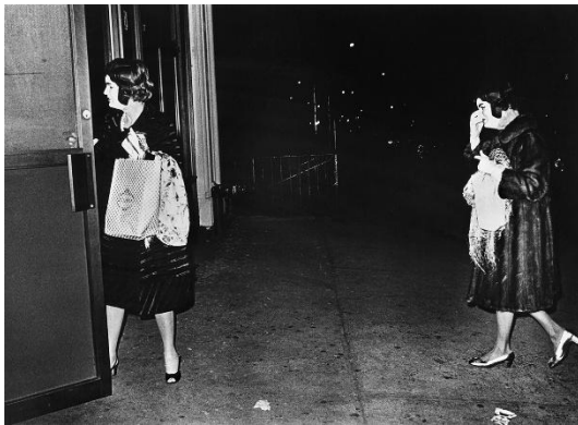
Ikko Narahara, "Two Ladies with Identical Jackie Kennedy Masks" from "Where Time Has Vanished", 1970/1973, gelatin silver print, 30.5 x 41.8 cm