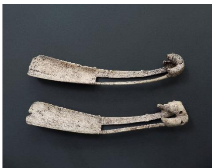
Nao Tsuda Grassland Tears "Usumoshi #2" 2016 LightJet print Image and paper size : 30 x 38 cm