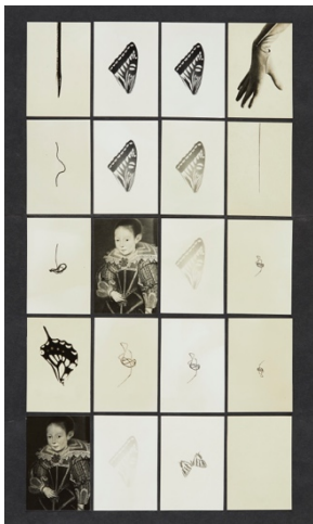
Kansuke Yamamoto “Butterfly”, 1970 Collage on paper, gelatin silver print 38.4 x 23 cm