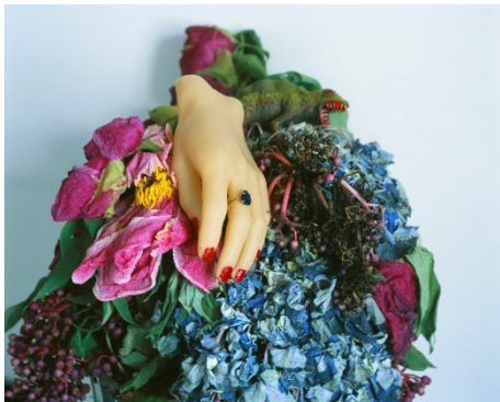
Nobuyoshi Araki "A Desktop Paradise", 2016 RP-Pro Crystal print Image size: 32.4 x 40.5 cm Paper size: 35.6 x 43.2 cm

Taka Ishii Gallery Photography Paris 119 rue Vieille du Temple 75003 Paris Tel: 01 42 77 68 98 www.takaishiigallery.com contact@takaishiigallery.com Mardi - Samedi 12h -19h