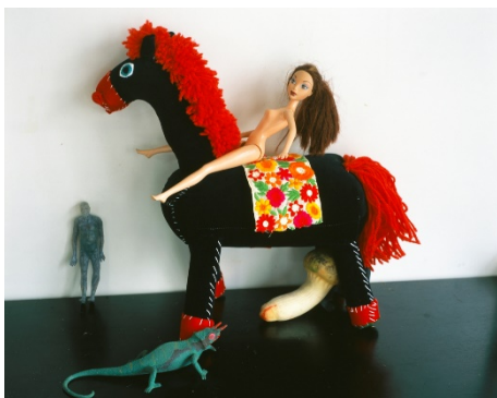
Nobuyoshi Araki "A Desktop Paradise", 2016 RP-Pro Crystal print Image size: 32.4 x 40.5 cm Paper size: 35.6 x 43.2 cm © Nobuyoshi Araki